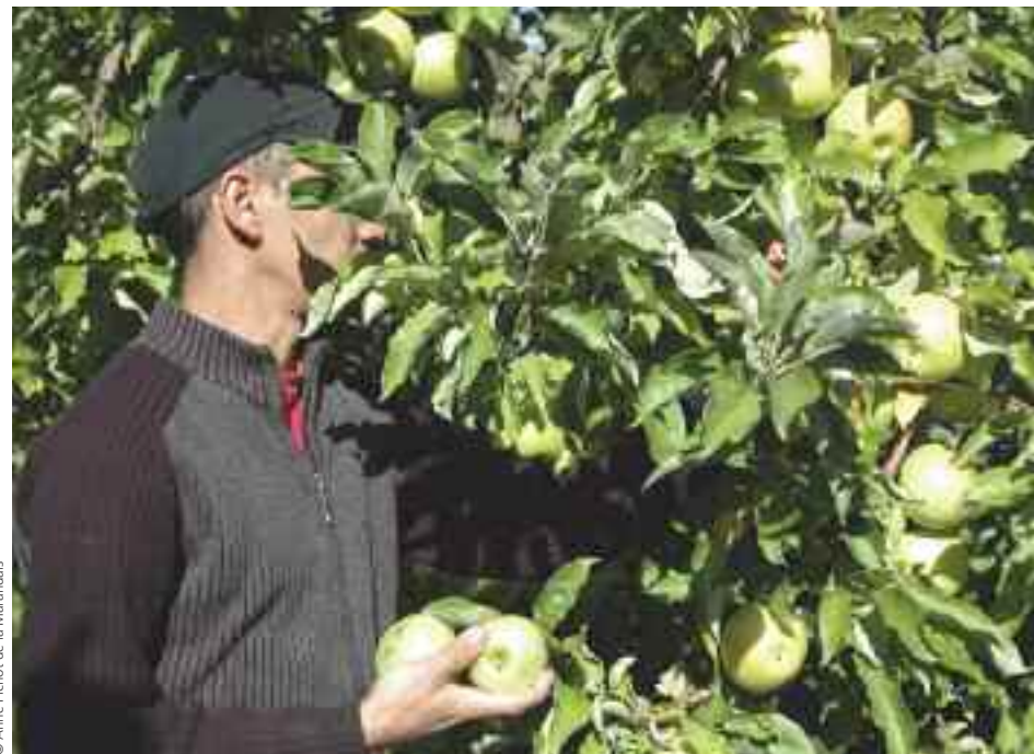
© Anne Pichot de la Marandais

« La sécurité d'un emploi fixe leur permet de se préparer à une vie active