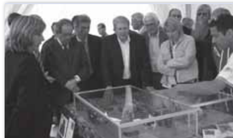
Les personnalités attentives aux explications données devant une maquette de contention réalisée par les élèves de la MFR de Bulgnéville.

Les différents formateurs ont apporté de nombreux conseils, appuyés par des démonstrations concrètes.